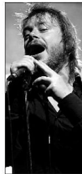
Attention talent : Clipper Tone. À droite, Jesus Volt, un groupe sous haut ampérage.

15.08.08 | Dauphiné Libéré « Attention talent: ClipperTone... »