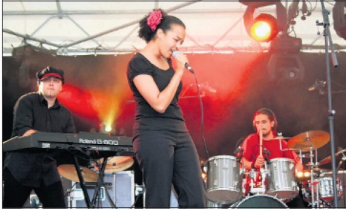
Un groupe né en 2005 qui souhaite multiplier les contacts avec le public.

L e groupe franco-suisse ClipperTone va créer l'événement vendredi soir, au Perce Oreille.